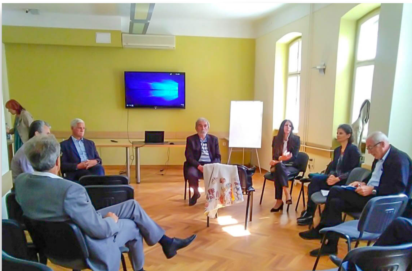
Припрема закључака Конференције у Центру покрета горана Војводине